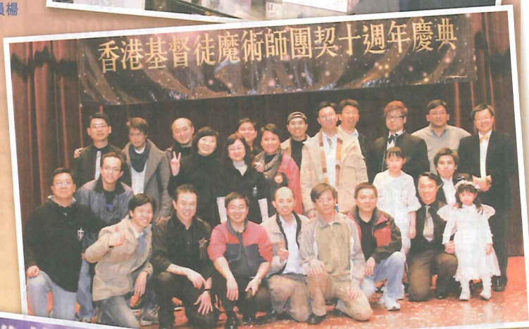
十週年匯演大合照